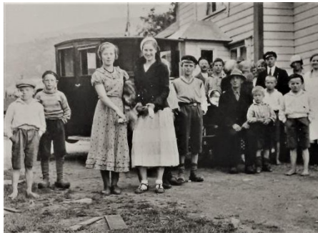
Søndagsbesøk fra Stavanger på Malmeim i 1933. Personer; se Bjerkreimboka IV side 2459.