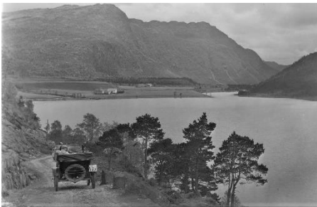
På veg mot Malmei.