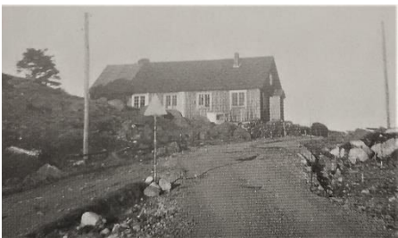
Ungdomshuset Fjellheim på Lutherbakken fra 1947, nedrevet i 1971.